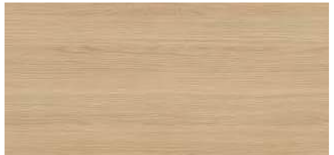
HP81 Egger Vicenza Eiche - H3157 ST12