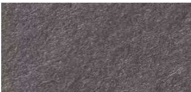
HP04 Arpa Luna Luserna Nero - 3366