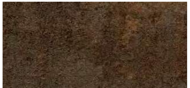
HP73 Pfeleiderer F76037 FG Phoenix braun