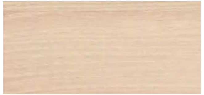
HP91 Egger Lakeland Akazie hell - H1277 ST9