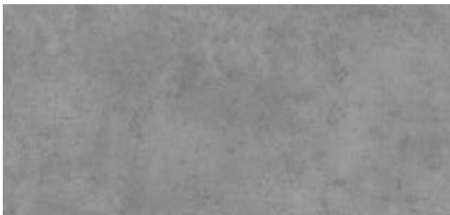
HP71 Egger Chicago concrete Hellgrau - F186 ST9