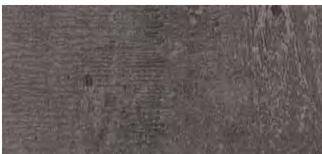
HP02 Egger beton - béton - concrete - F275 ST9