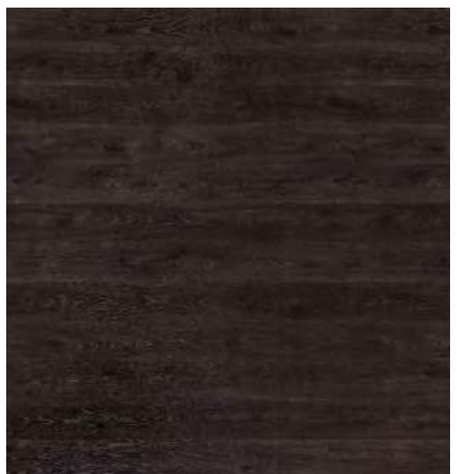
HP08 Unilin Minnesota Oak chocolat H441