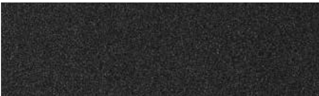
EP01 traffic black struct. (RAL9017)