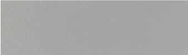
EP12 imit. aluminium (RAL9006)