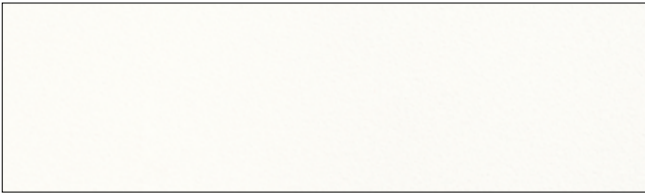
EP91 signal white (RAL9003)