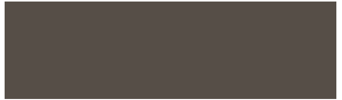
EP75 imit. RVS - inox. - stainl. steel